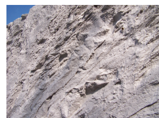
Felsstruktur auf Anfrage